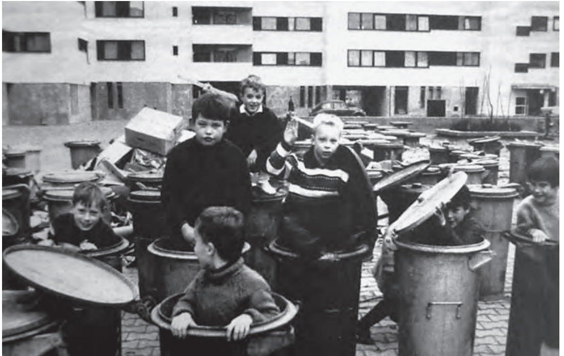
Abb. 7: Foto von im Märkischen Viertel in Mülltonnen spielenden Kindern aus dem Wochenmagazin Stern.

Wochenmagazins Stern, das unter dem wenig schmeichelhaften Titel „Leben wie im Ameisenhaufen“ unter anderem vor Wohnhäusern der Großsiedlung in Mülltonnen sitzende Kinder abbildete 29 – eine Szene, die das Klischee des trostlosen Massenwohnungsbaus am Stadtrand aufs Neue bediente (Abb. 7).