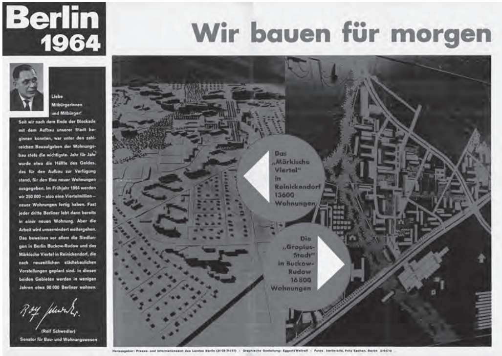
Abb. 8: Ein Werbeplakat des Bausenators R. Schwedler für das Märkische Viertel und die Gropiusstadt.