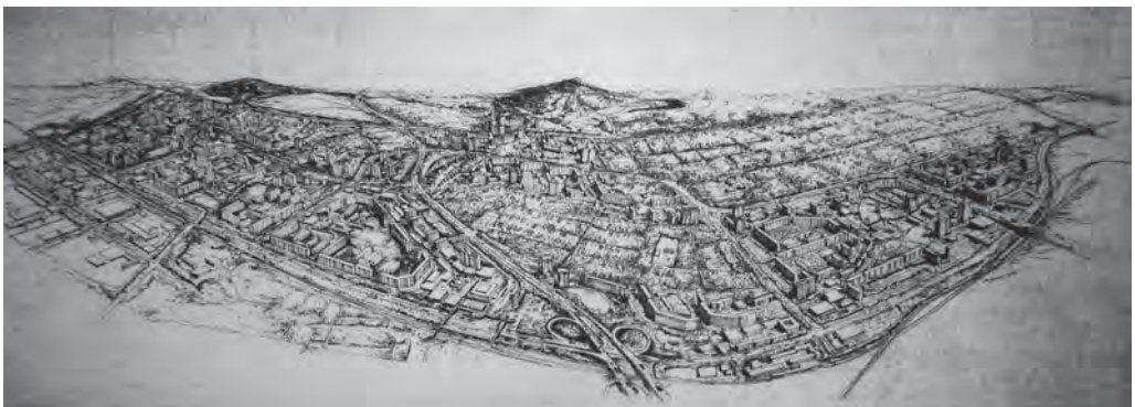
Abb. 2: Marzahn in einer Zeichnung von D. Urbach aus dem Jahr 1977.