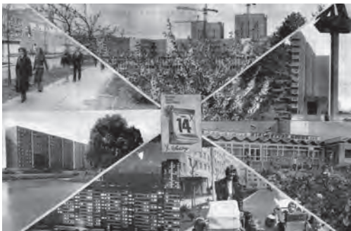
Abb. 9: Eine Collage mit Bildern der neuen Großsiedlung Marzahn aus dem Wahlaufdruck der Nationalen Front 1981.

Drittens begründet die Schwerpunktsetzung auf das Märkische Viertel und Marzahn – und dieser Aspekt darf im Zusammenhang mit dem angestrebten Ost-West-Vergleich als der entscheidende gelten – der ehrgeizige Anspruch beider Siedlungen, Vorbildcharakter für den künftigen Wohnungsbau einzunehmen und zugleich die Überlegenheit des jeweiligen Systems zu demonstrieren (Abb. 8 und 9). Das Märkische Viertel sollte eine „Stadt von Morgen“ 51 und eine „neue Gesellschaft“ 52 repräsentieren. Auch war von einem neuen Schritt im europäischen