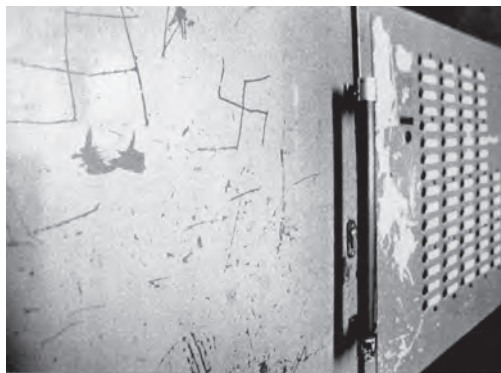
Beschädigter Hauseingang im Märkischen Viertel: Wüten gegen Farbe und Beton

Die Ausstellung, der zahlreiche weitere kritische Veranstaltungen und auch Publikationen aus dem universitären Dunstkreis mit ähnlicher Stoßrichtung folgten, 19 verfehlte ihre Wirkung nicht. Als entscheidender Multiplikator fungierte das Nachrichtenmagazin „Der Spiegel“, welches unter der Schlagzeile „Slums verschoben“ ausführlich über die Berliner Anti-Bauwochen berichtete. 20 Der Artikel verhalf der Aktion 507 nicht nur zur bundesweiten Aufmerksamkeit, sondern schloss sich der wenig differenzierten Haltung der Ausstellungsmacher an. „Tatsächlich“, so der Spiegel in bewusst plakativer Formulierung, „zählt die Mammut siedlung im Norden Berlins zu den trostlosesten Gewächsen der Beton-Architektur.“ 21