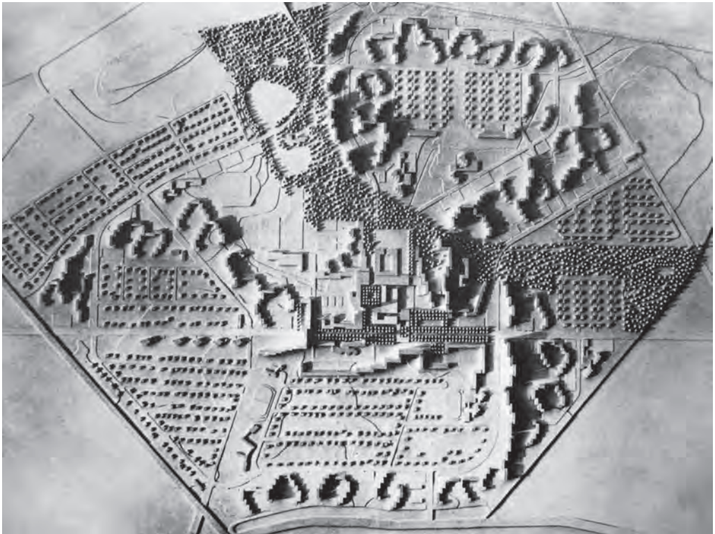
Abb. 1: Das Märkische Viertel im Modell (Planungsstand um 1970).