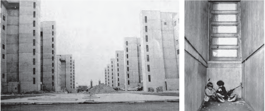
Abb. 4 und 5: Im Rahmen der „Anti-Bauwochen“ an der TU Berlin 1968 gezeigte Fotos vom Märkischen Viertel.