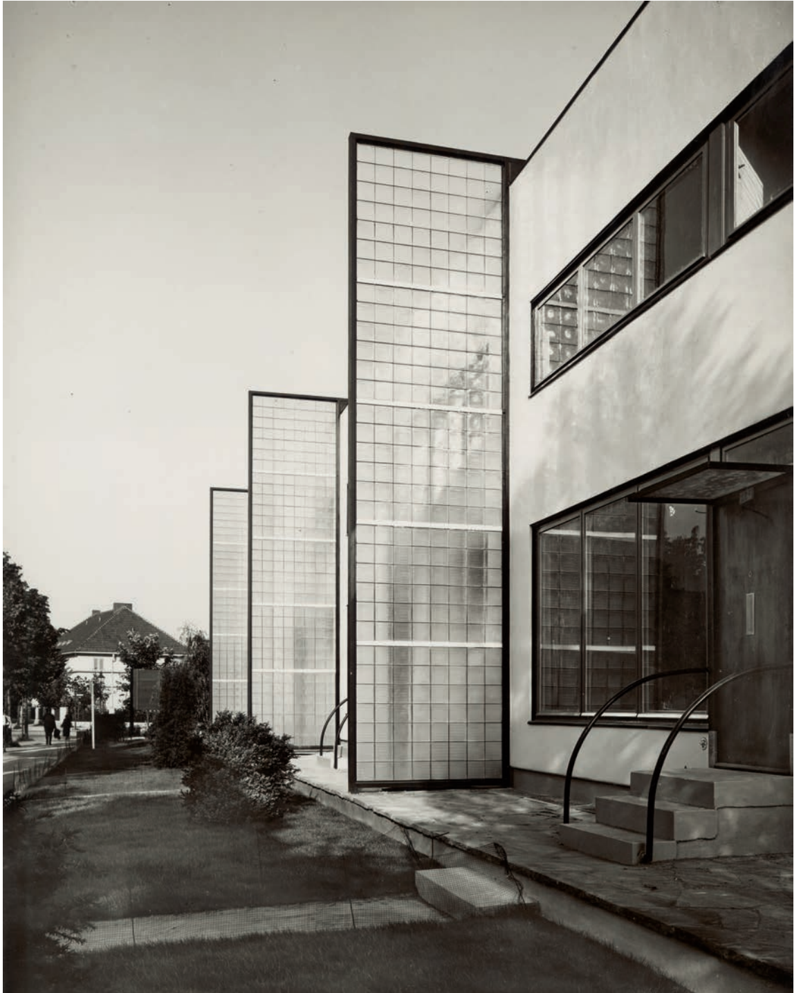
Reihenhäuser Schorlemerallee 12–12c, 1929/30