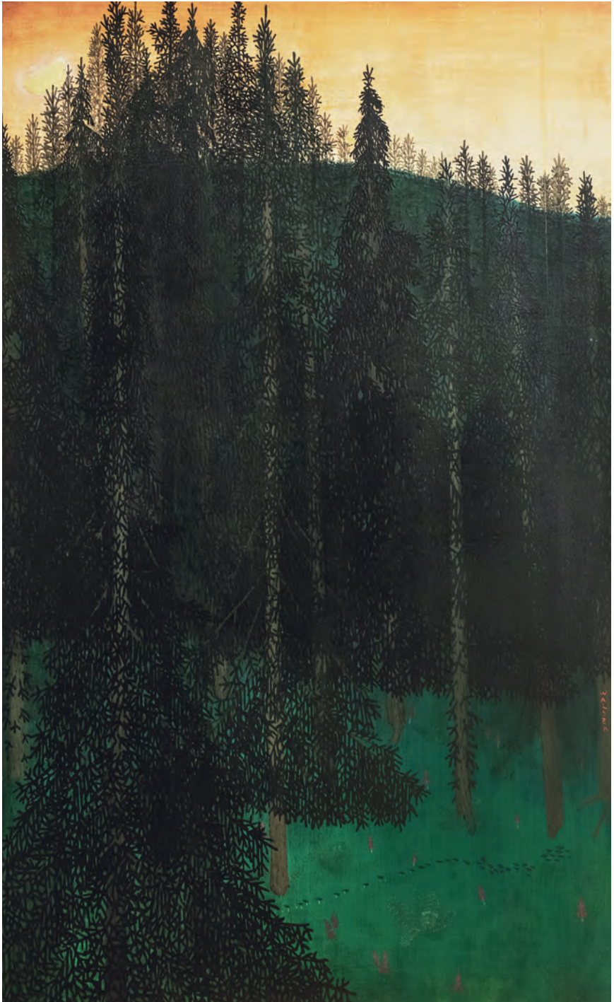
Abb. 4 Karl Walser, Der Wald , um 1902/1903, Öl auf Holz, 72 x 43 cm, NMB Neues Museum Biel