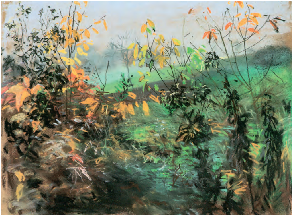
Abb. 2 Karl Walser, Herbstlandschaft , um 1898, Pastell, 31 x 38,5 cm, Privatbesitz

Himmel durchblicken lassen. Mit der vielfältigen Farbabstufung von Grün-, Braun- und Beigetönen suggeriert Walser räumliche Tiefe und eine lebendige naturnahe Atmosphäre. Durch den brauntonigen Charakter und die verhaltene Lichtregie reiht sich das Bild in die Tradition der deutschen Impressionisten, die Walsers frühe Zeitgenossen wie Wilhelm Trübner (1851–1917) und Hermann Pleuer (1863–1911) in ihren Naturschilderungen veranschaulichen. 34