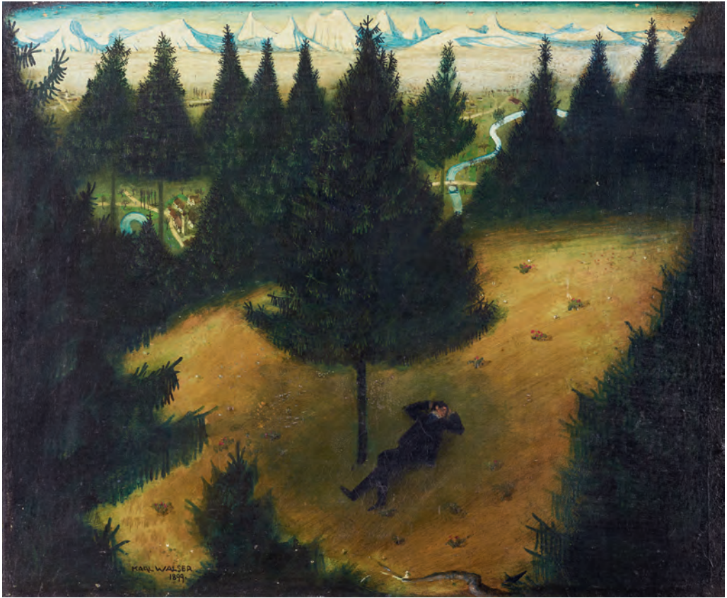
Abb. 3 Karl Walser, Blick auf die Alpen , 1899, Öl auf Karton, 30 x 36,5 cm, Privatbesitz

befriedigte mich das Malen vor der Natur nicht mehr“, schrieb er im Lebenslauf 1927 zuhanden der Berliner Akademie der Künste, „und ich fing an, meine Träume hinter geschlossenen Fensterläden auf die Leinwand zu bringen.“ 35 Mit diesem visuellen Grundprinzip näherte sich Walser jenen Strömungen an, die um 1900 die Tradition der Romantiker wiederentdeckten. Im damaligen Berlin stand vor allem Caspar David Friedrich (1774–1840) im Fokus, dessen Werke in der Jahrtausendausstellung von 1906 in der Berliner Nationalgalerie zu sehen waren. Friedrichs Zeitgenosse G. F. Kersting malte den Freund in seinem Atelier. Friedrich arbeitete, so will es das Bild, zwischen kahlen Wänden und verriegelten Fenstern und machte die Regel geltend: „Derjenige Maler, der keine Welt in sich selbst sieht, unterlasse es zu malen.“ 36