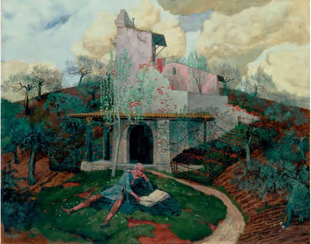
Abb. 5 Karl Walser, Eremit , 1907, Öl auf Leinwand, 64 x 80 cm, Sammlung Mayenfisch, Kunsthaus Zürich

zusammen. Nicht die Topografie, sondern das seelische Befinden wird zum Gegenstand der Darstellung. Der Wald vermag dem Schläfer die ersehnte Ruhe und Geborgenheit zu geben. An diesem Ort ist auch die künstlerische Imagination gewährleistet. Die Berge am oberen Bildrand erscheinen in ihrem Licht und den kantigen Formen beinahe unwirklich, obwohl als Aussicht vom Solothurner Weißenstein auf die Berner Alpen leicht zu erkennen. Die Bergspitzen tauchen aus einem Nebelband auf und bilden ein breites Panorama. Ebenso gleichförmig und spitz wie die Berge gestaltet Walser die Tannen, die um die Waldwiese eine schützende Grenze bilden. Die dichten Äste werden von merkwürdig dünnen Stämmen getragen. In ihrer dunklen Farbe und den trapezartigen Formen, die selbst im Umriss der Waldwiese wiederkehren, vermitteln sie eine surreale und schwebende Komponente.