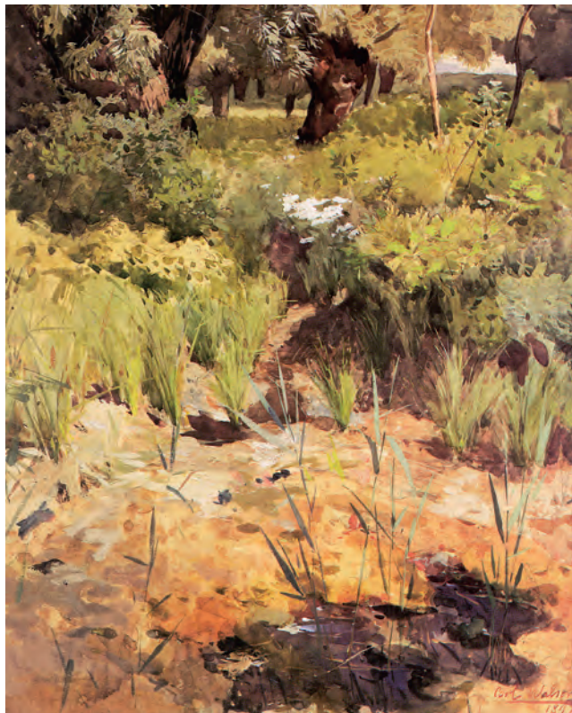
Abb. 1 Karl Walser, Landschaft , um 1897, Aquarell, 47,5 x 36,5 cm, Privatbesitz

und städtebaulichen Veränderungen, sowie den Menschen, die ihm auf der Straße und im näheren Umfeld begegneten. Eine in sich geschlossene Werkgruppe in Walsers Œuvre bilden die Gemälde, Aquarelle und Skizzen, die anlässlich der Japanreise im Jahr 1908 entstanden.