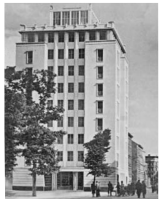
Hochhaus an der Weberwiese

Wie konnte in der jungen DDR ideologisch bestimmt eine neue Architektursprache auf Grundlage ausgerechnet des überkommenen Formenbestandes des Klassizismus entwickelt werden, dem ‚alten‘ Erbe der kapitalistischen Epoche? Für die gesellschaftspolitischen Eliten der SBZ/DDR in den 1950er Jahren bildete Architektur ein integrales Mittel im Aufbau einer neuen, sozialistischen Gesellschaft. Die Baukunst sollte ihrem »Inhalt nach sozialistisch« und ihrer »Form nach national« sein, wofür das »historische Erbe« und die »deutsche Architektur« als Bezugspunkt gewählt wurden. Der Ansatz ist umso überraschender, als viele Bauschaffende wie Hermann Henselmann oder Hanns Hopp in der modernen Architektur verankert waren. Während die Architektur des Westens und der Moderne als bloßer Formalismus diffamiert wurden, kritisierte der Westen wiederum diese Bezugnahme auf den Historismus des 19. Jahrhunderts in der DDR. Alexander Karrasch arbeitet die ideologischen, philosophischen und gesellschaftspolitischen Hintergründe der Bemühungen um einen eigenen architektonischen Stil bis zum Tod Stalins (1953) heraus.