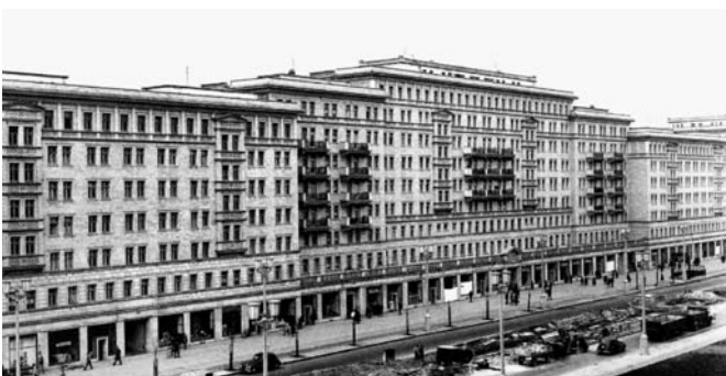
Stalinallee, erster Bauabschnitt